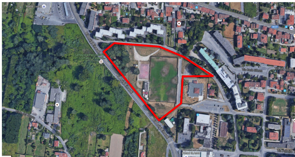
Figura 2 – Inquadramento: vista satellitare del tratto di interesse.